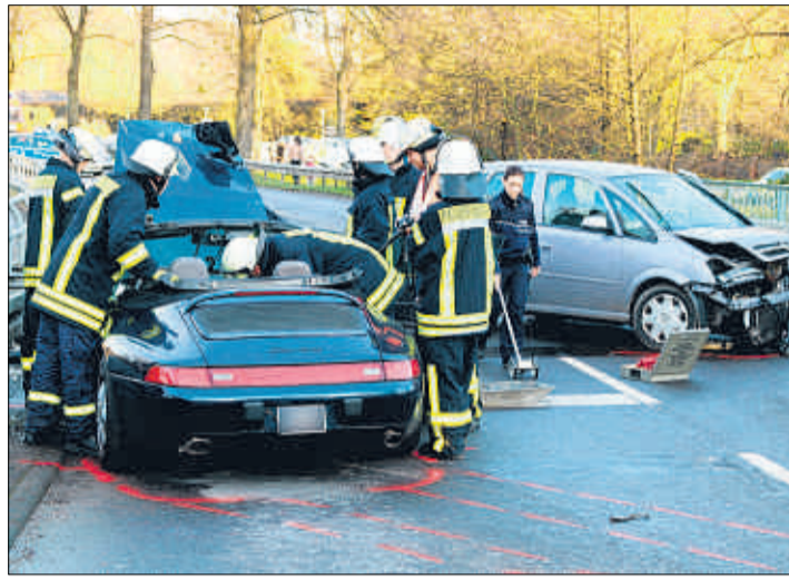
Schwere Verletzungen erlitt ein 72 Jahre alter Mann bei einem Zusammenstoß auf der B 55.